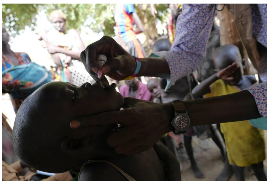
Vaccinazione sul territorio della contea di Yirol West

Tra le 12 contee di intervento vi sono anche quelle di Cuibet , Yirol West e Rumbek Centre dove, attorno agli omonimi ospedali di contea, gravita circa un milione di persone. Nel corso del 2020, il sistema di riferimento di queste strutture ha fatto largo uso di un sistema di trasporti con motocicletta . Questi mezzi hanno permesso allo staff delle strutture sanitarie periferiche (Centri di salute e dispensari attivi sul territorio) di portare le vaccinazioni di routine nei villaggi più remoti.